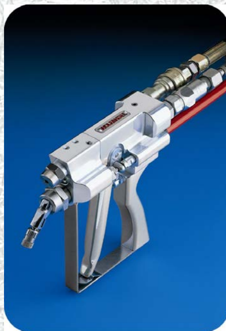
Airless-Külső keverésű gélszóró pisztoly