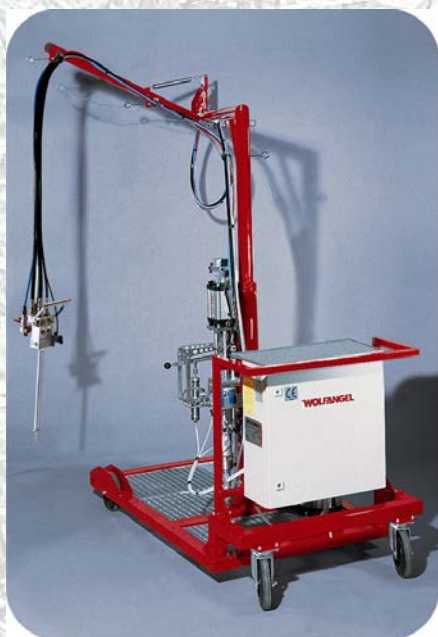
Injektáló karos kocsin