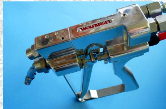
Gélszóró-pisztoly külső keveréssel